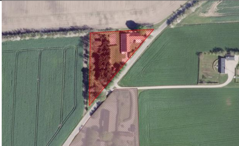
Området der ikke indgår som byzone i lokalplan nr. 4 V-1.

Ifølge lokalplan nr. 4 V-1, tillæg nr. 4 for Aars Kommune (1983), indgår matr. 28b Vognsild By, Vognsild, ikke i lokalplanen for området. Området er nuværende angivet som "byzone" på tilgængelige kortdata (kort.plandata.dk). Der anmodes derfor om at ændre områdets indtegning/status, således dette ikke indgår i byzone. Området ses på nedenstående kort.